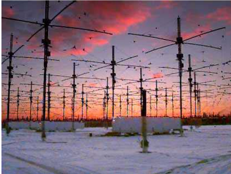
Antenas del proyecto HAARP en Gakona, Alaska.

Por lo tanto, HAARP es uno más de estos proyectos militares llevados a cabo por la Defensa americana. Volvamos a lo que conocemos de este proyecto.