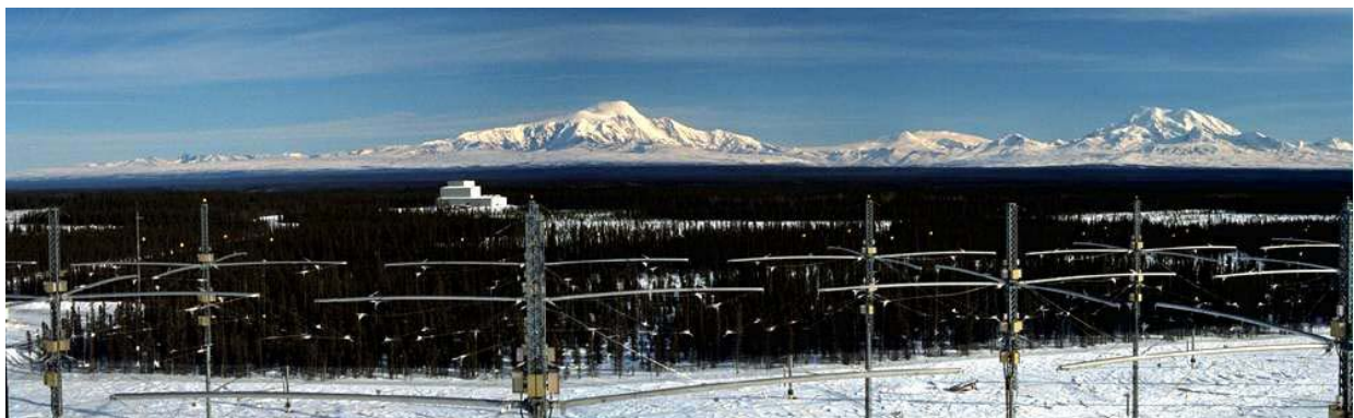
Vista parcial de las instalaciones HAARP en Alaska

El HAARP actuaría como un gran calentador ionosférico, el más potente del mundo. En este sentido podría tratarse de la más sofisticada arma geofísica construida por el hombre.